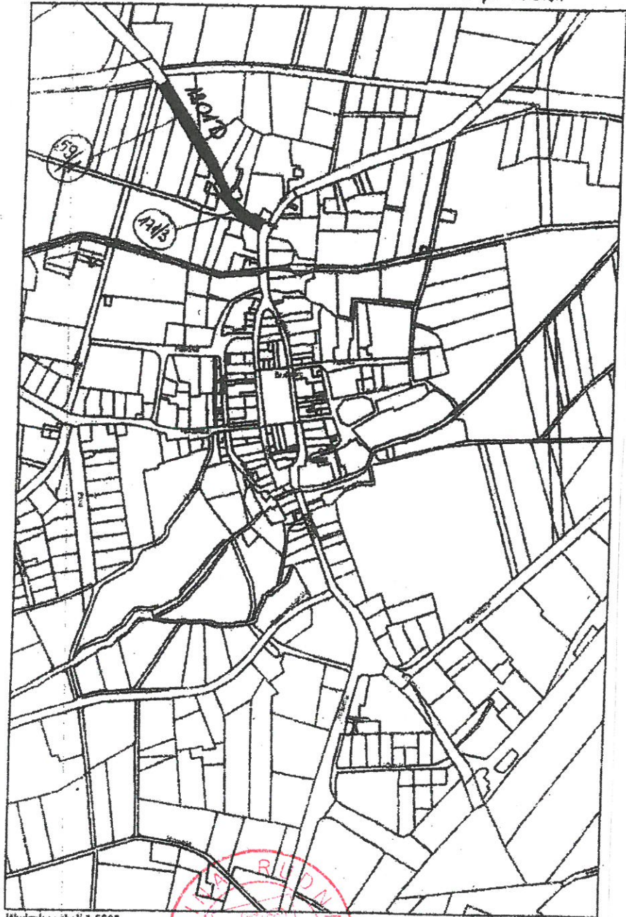
Wydruk mapy z systemu WebEwid OBRĘB RUDNA