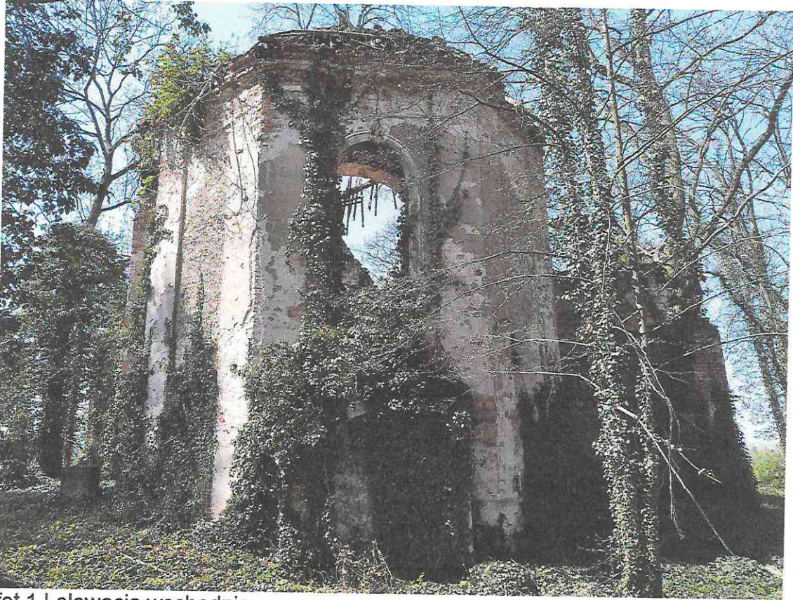
fot.1 | elewacja wschodnia