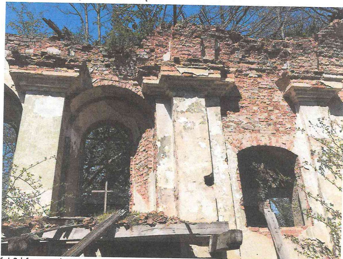
fot.6 | fragment empor