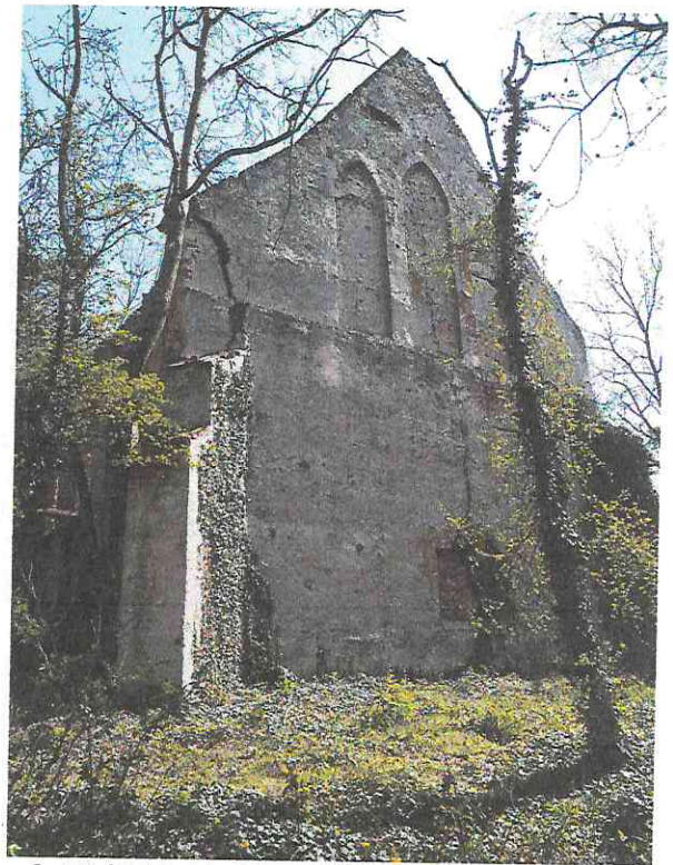
fot.3 | elewacja zachodnia