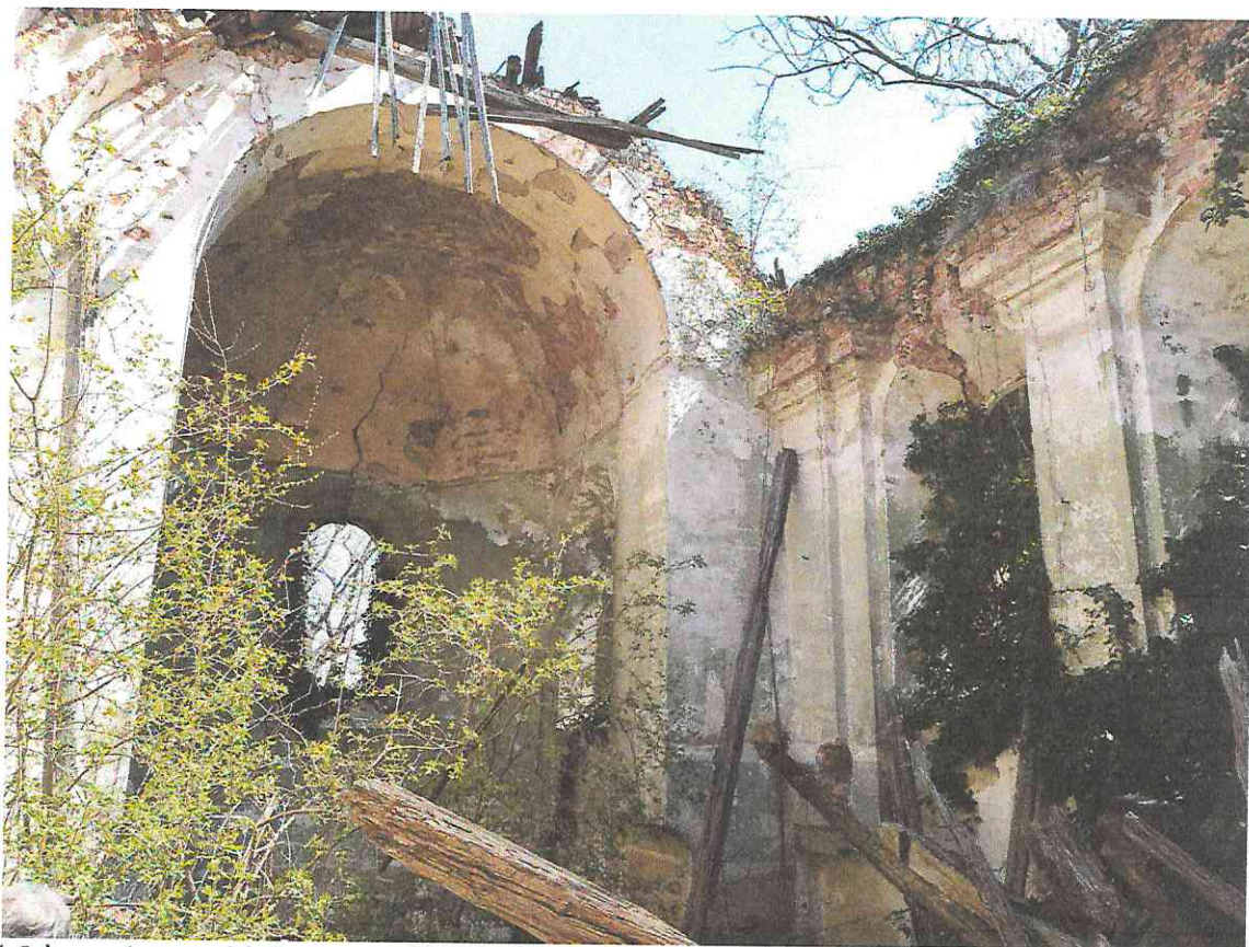
fot.6 | wewnątrz, widok na prezbiterium