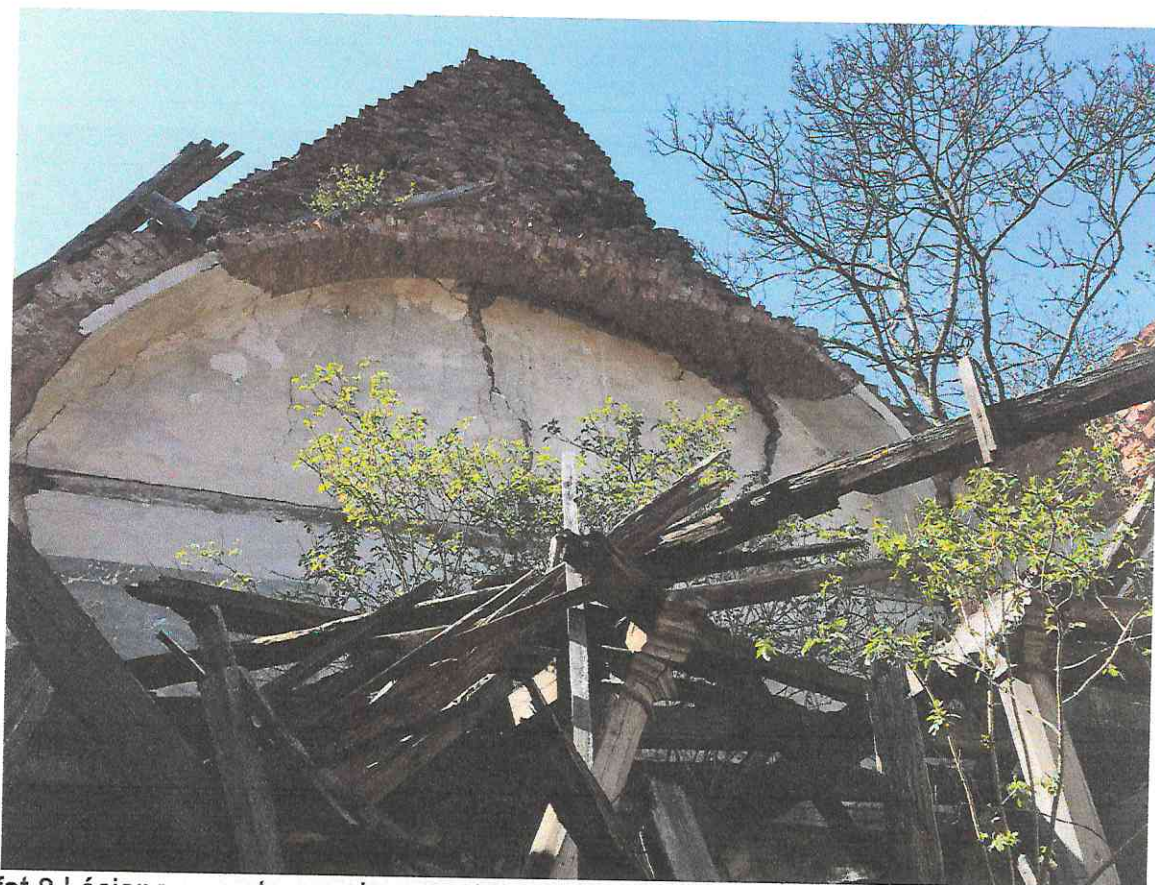
fot.8 | ściana szczytowa od wewnątrz