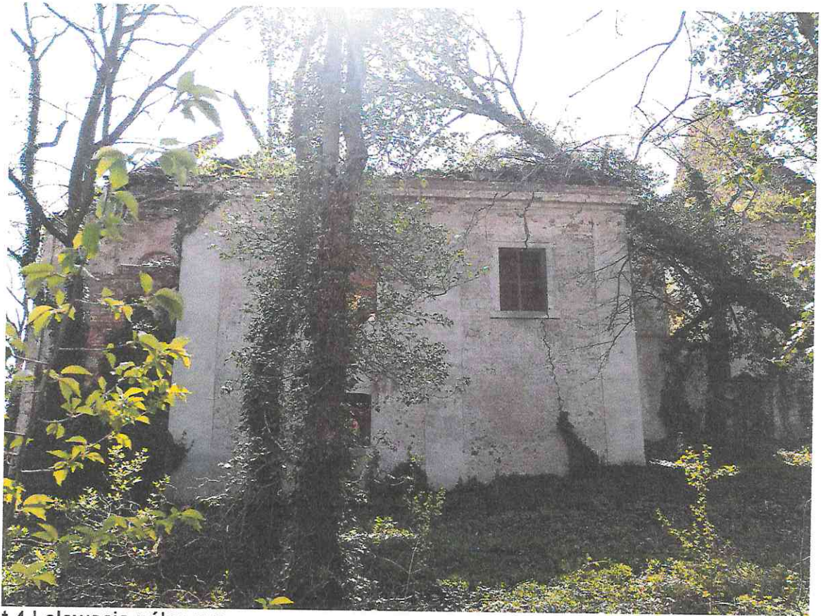
fot.4 | elewacja północna