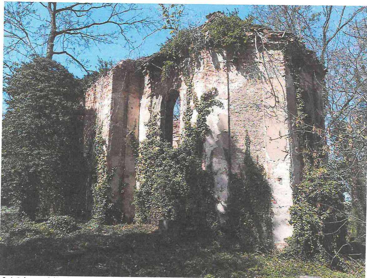
fot.6 | prezbiterium