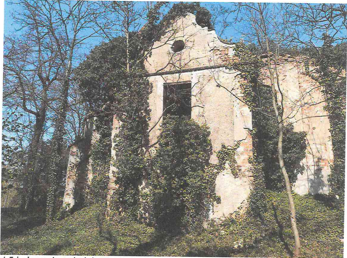
fot.5 | elewacja południowa wraz z kruchtą