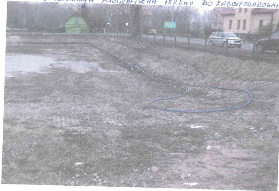
FOT. 2 DOKUMENTACJA FOTOGRAFICZNA STUJENKI PRZECIWPADAJĄCEJ